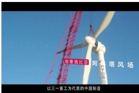
以三一重工为代表的中国制造