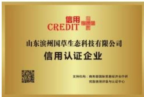
“信用+” 认证荣誉牌匾

商务部国际贸易经济合作研究院官网，建立“信用+”认证专属页面。权威网站建档，有效提升品牌的公信力。