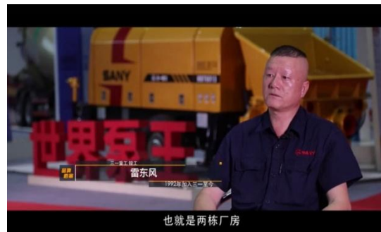
重要人物讲述品牌发展中的关键事件