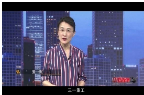
知名主持人担任讲述人讲述品牌历史

针对有实用新型技术的高新企业，推荐相关节目，CCTV10科技类专题栏目同步播出。