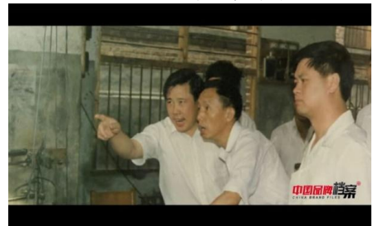
结合品牌发展重要文献、物件进行展示